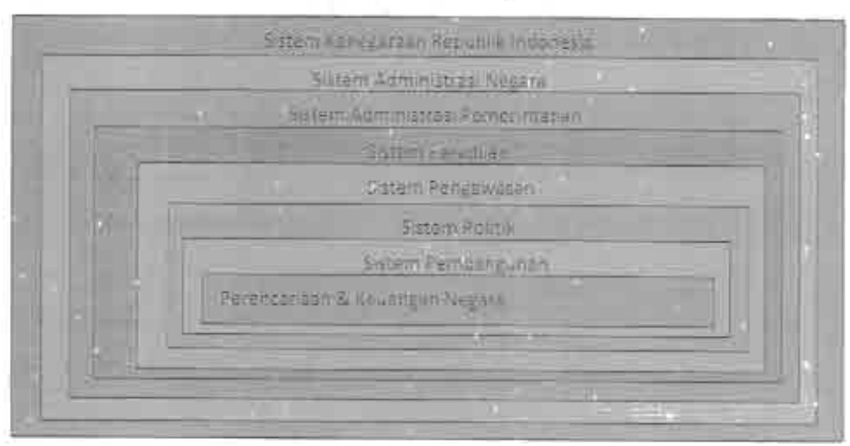
Gambar 1. Sistem Kenegaraan Republik Indonesia

Dalam sistem kenegaraan Indonesia yang kompleks, sistem pengelolaan keuangan negara adalah sub sistem yang memiliki interaksi kelembagaan paling kecil namun menentukan dalam seluruh rangkaian proses kelembagaan yang berlangsung di seluruh sistem kenegaraan tersebut. Sistem Keuangan negara merupakan determinan dari terselenggaranya sistem-sistem tersebut sesuai peran dan fungsinya masing-masing. Sistem kenegaraan Indonesia secara komprehensif digambarkan oleh Wrihatno dan Nugroho 34 seperti pada gambar berikut ini.