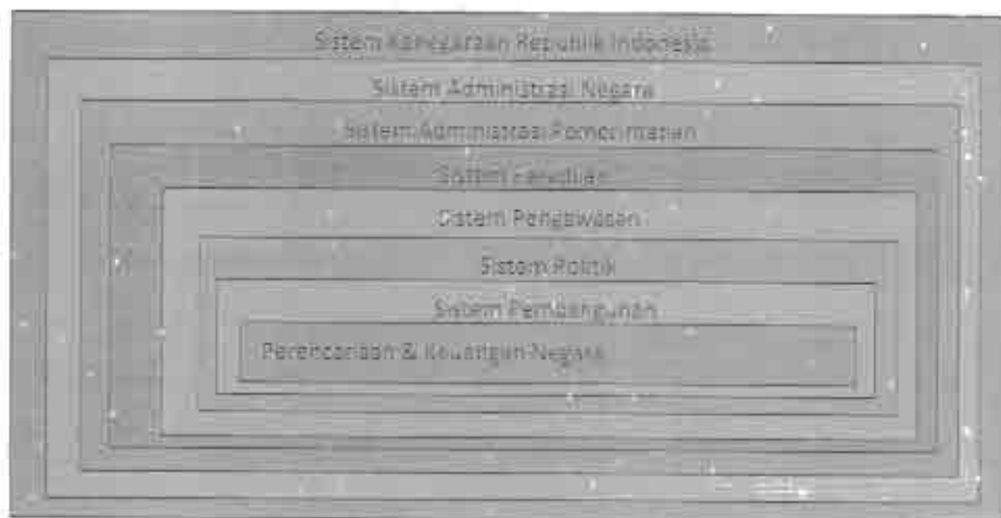
Gambar 1. Sistem Kenegaraan Republik Indonesia

Dalam sistem kenegaraan Indonesia yang kompleks, sistem pengelolaan keuangan negara adalah sub sistem yang memiliki interaksi kelembagaan paling kecil namun menentukan dalam seluruh rangkaian proses kelembagaan yang berlangsung di seluruh sistem kenegaraan tersebut. Sistem Keuangan negara merupakan determinan dari terselenggaranya sistem-sistem tersebut sesuai peran dan fungsinya masing-masing. Sistem kenegaraan Indonesia secara komprehensif digambarkan oleh Wrihatno dan Nugroho 34 seperti pada gambar berikut ini.