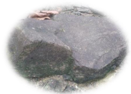
BATU TEMPAT DUDUK KI NUR AHMAD

Di wilayah ini juga ada seorang Empu yang cukup cakap dalam membuat berbagai pusaka dan senjata, ketika sang Empu meninggal, jenazahnya dimakamkan di sebelah selatan karangsembung di pekarangan beliau, dan beliau menjadi orang pertama yang dimakamkan di situ, yang pada akhirnya tempat tersebut menjadi makam karangsembung. Bersamaan dengan zaman tersebut di wilayah