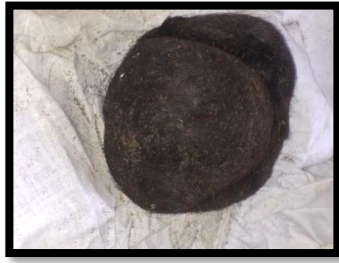
RAMBUT PENINGGALAN KI NUR AHMAD