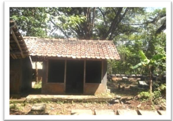
LUGU MAKAM KARANGSEMBUNG