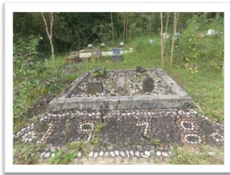
MAKAM NYI MELATISARI/MBAH LUMBU

sangkutan beliau berujar, ini karena ada pohon durian perjalananku jadi terhambat, maka tempat ini aku beri nama Kedung Duren (kedung yang ada pohon duriannya).