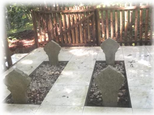
ASTANA NYI RONGGENG

Masih pada abad 17 yaitu pada masa pemerintahan Amangkurat II di Mataram pernah ada seorang telik sandi wanita yang cantik jelita ditugaskan di wilayah perbatasan dengan kabupaten Banyumas, fungsi dari telik sandi ini adalah untuk memberikan informasi seakurat mungkin tentang kondisi di wilayah perbatasan. Telik sandi ini bernama Siti Sumirat, beliau tidak sendirian, ditemani oleh ibunya yang sudah janda bernama Rekxa Sirih, untuk menyamar siapa jati diri Siti Sumirat, maka beliau menyamar menjadi seorang Lengger/Ronggeng.