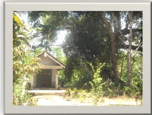
PANEMBAHAN MBAH AGUNG KUNING

paksaan, harus dengan santun dan arif. Adapun salah satu santri beliau yang berjudul Ki Kuning (konon beliau berkulit warna kuning), menuju arah barat, dari Bukit Jungklang Ki Kuning turun untuk mengambil air wudlu di suatu Mata Air, dan menjalankan sholat tidak jauh dari tempat tersebut. Setelah menjalankan sholat, Mbah Kuning kemudian meneruskan perjalanan ke arah barat sesuai petunjuk Sunan Kalijogo. Semenjak itulah telaga/mata air tersebut di juluki Panembahan Mbah Agung Kuning. Di sebelah timur Panembahan ada pohon Ketapang yang konon di situlah berbagai benda bertuah disimpan.