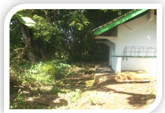
MAKAM KI AGENG MONCAR COKRO KUSUMO

mendapatkan Nyi Ronggeng (Siti Sumirat), suatu ketika terjadi perkelahian hebat antara berbagai pendekar. Akibat perkelahian ini Nyi Ronggeng dan ibunya menjadi Korban amukan para pendekar yang sedang mabuk Tuak karena pengaruh Tuak, setelah meninggal ibu dan anak ini dimakamkan berdampingan. Dan makam ini di sebut makam Nyi ronggeng/ Astana ronggeng . Semenjak itu para sesepuh berpesan, bila ingin mencari keberhasilan dalam segala usaha, maka berdoalah ditempat tersebut, dan bila menemukan barang