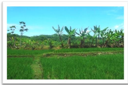
ASTANA CHINA KARANG CENGIS

Karena saking sengitnya dan serunya pertempuran ini sampai berlangsung sehari-hari,