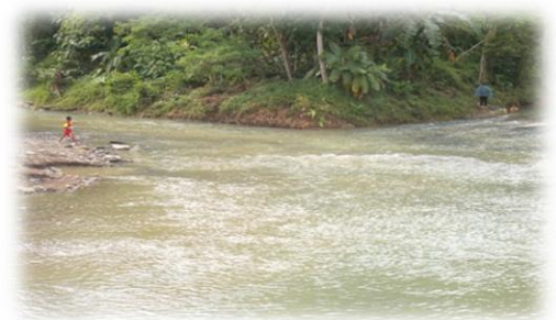
SUNGAI TEMPURAN/KALI CAWANG

Pada saat yang bersamaan datanglah seorang Waliyulloh yaitu Sunan Bonang bersama kedua pengikutnya, beliau mengambil air wudlu dan mandi di sebuah tempuran sungai/cawangan sungai, sehingga barang siapa ingin mendapatkan kemuliaan di dunia maka dapat melaksanakan ritual mandi di tempuran kali tersebut di bulan Syaban atau Sura dan berdoa kepada Allah SWT. Setelah mengambil air wudlu dan mensucikan diri Sunan Bonang bersama kedua pengikutnya meneruskan perjalanan ke arah barat dengan tujuan Cirebon, tidak jauh berjalan kedua pengikutnya mengambil air minum di suatu mata air dan mempersilahkan Kanjeng Sunan untuk ikut meminumnya, konon mata air ini di bawah sebatang kayu besar. Dan barang siapa ingin terkabul do'anya dapat munajat di tempat ini (kelak tempat tersebut diberi nama Tlaga Jati ).