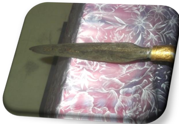
TOMBAK TUNGGUL WULUNG