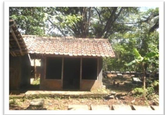
LUGU MAKAM KARANGSEMBUNG