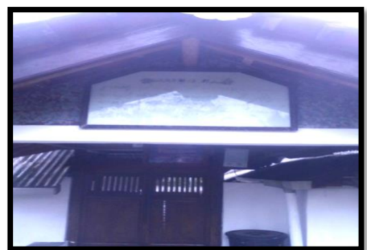
MAKAM RADEN KAJORAN/PANEMBAHAN ROMO KAJORAN AMBALIK

Pada Sekitar tahun 1677 Masehi Raden Kajoran bersama Pangeran Trunojoyo mengadakan pemberontakan ke Amangkurat Agung, adapun alasan pemberontakan tersebut karena tidak senang dengan perilaku raja amangkurat yang selalu bekerjasama dengan VOC Belanda, padahal pada zaman ayahanda beliau yaitu Sultan Agung sangat tidak mau bekerjasama dengan VOC, selain itu alasan yang lain yaitu