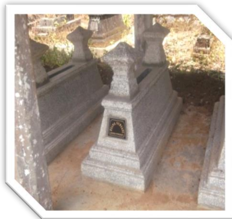
MAKAM KI SURYANI/SURYANINGRAT

Pada masa jabatan beliau di wilayah Sawangan datang seorang pintar bernama Ki Suryani bersama seorang isteri dari Pasir Luhur, dan dari beliau kemudian wilayah dukuh Sawangan mulai di