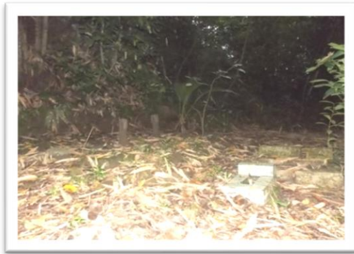
TLAGA WUNGU INDAKILA