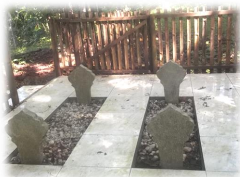
ASTANA NYI RONGGENG