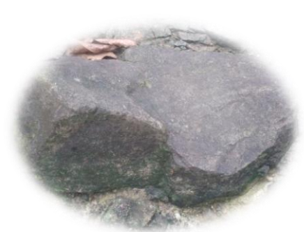
BATU TEMPAT DUDUK KI NUR AHMAD

Di wilayah ini juga ada seorang Empu yang cukup cakap dalam membuat berbagai pusaka dan senjata, ketika sang Empu meninggal, jenazahnya dimakamkan di sebelah selatan karangsembung di pekarangan beliau, dan beliau menjadi orang pertama yang dimakamkan di situ, yang pada akhirnya tempat tersebut menjadi makam karangsembung. Bersamaan dengan zaman tersebut di wilayah