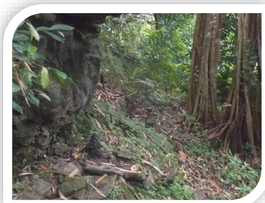
PETILASAN MBAH SINGANDANU INDRAKILA

Selama semedi ada beberapa burung yang sedang mengambil aneka dahan dan ranting kering untuk membuat sarang, anehnya membuatnya sarang tepat di atas kepala Singandanu yang sedang semedi, selesai semedi