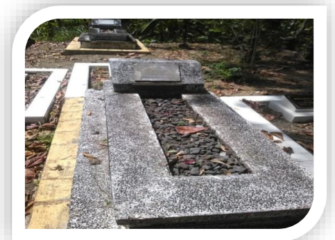
MAKAM EYANG R. NGAB. DJOJOSENTIKO DI JUNGKLANG