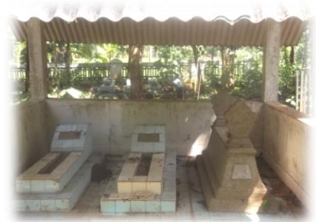
MAKAM KI SANTADIMEJA

Pada masa jabatan beliau di sebelah selatan Kedung Dalem ada sebuah kedung dan anehnya ditengah-tengah ada potokan kayu/bugel, maka semenjak itu wilayah sebelah timur kedung dalem diberi nama Kedung Bugel .