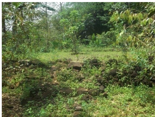
PUNDEN MAS SIGIT

Punden berundak tiga yang diperkirakan pada era zaman sebeu hindu budha masuk tanah Jawa, posisi Menghadap ke arah barat, karena pintu masuk disebelah timur, fungsi tempat tersebut