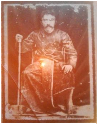
RESODIMEDJO PENATUS KRETEG