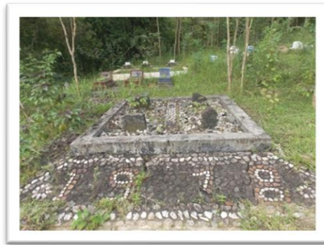
MAKAM NYI MELATISARI/MBAH LUMBU

sangkutan beliau berujar, ini karena ada pohon durian perjalananku jadi terhambat, maka tempat ini aku beri nama Kedung Duren (kedung yang ada pohon duriannya).