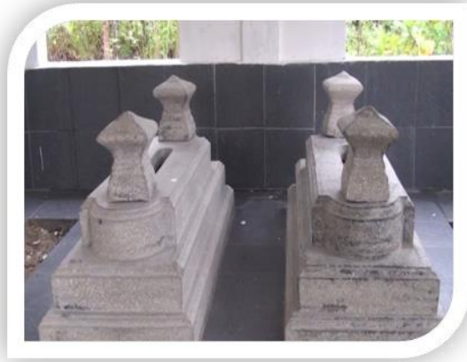
SYECH SAYYID COKRO MU'MIN