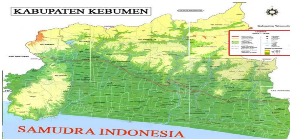
Gambar 2.1. Peta Kabupaten Kebumen

Luas wilayah Kabupaten Kebumen adalah 128.111,50 hektar yang terbagi dalam 26 kecamatan, terdiri dari 449 desa dan 11 kelurahan.