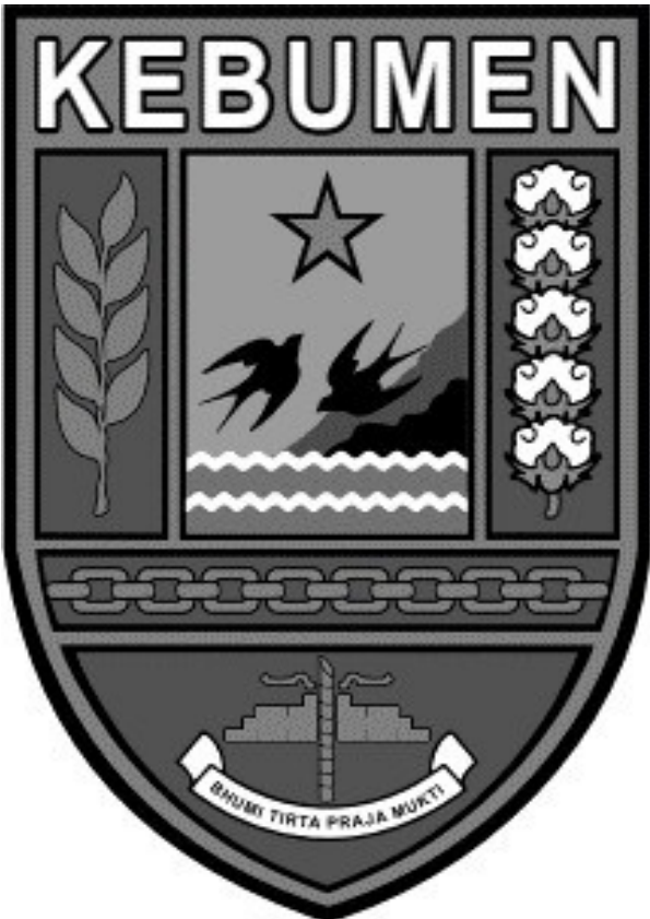
BENTUK DALAM WARNA HITAM PUTIH