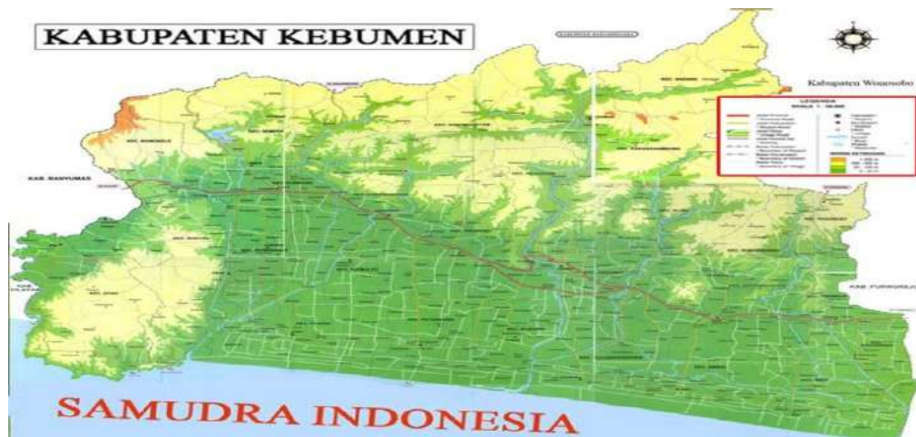
Gambar 1 Peta Kabupaten Kebumen

Luas wilayah Kabupaten Kebumen adalah 128.111,50 hektar yang terbagi dalam 26 kecamatan, terdiri dari 449 desa dan 11 kelurahan.